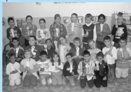
Záložka do knihy spája školy

Na podporu umenia nezabúdame ani na našej základnej škole a popri množstve iných aktivít, vychovávame deti aj k umeniu. Navštívili sme bábkové divadlo v Košiciach. Pozreli sme si rozprávku Neposedné kozliatka a vlk. V októbri zavítali do našej školy prešovskí herci z divadla PORTÁL. Zahrali nám rozprávku Žabia princezná. Podanie bolo naozaj výborné.