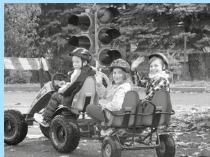
Dopravné ihrisko v Sobranciach