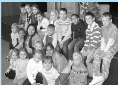
Bábkové divadlo v Košiciach